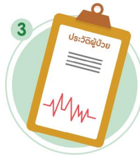
3 ประวัติการเจ็บป่วยในอดีต