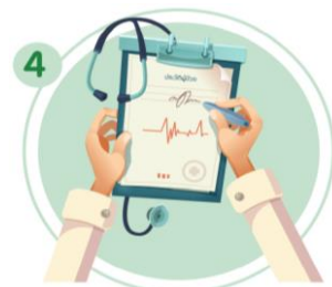
4 ประวัติการเจ็บป่วยในปัจจุบัน โดยเฉพาะโรคหลอดเลือดหัวใจโรคตับ และโรคไต