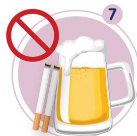
7 พฤติกรรมเสี่ยง เช่น การดื่มสารเสพติด การดื่มแอลกอฮอล์ การใช้ยุงที่ผิดกฎหมายมาก่อน