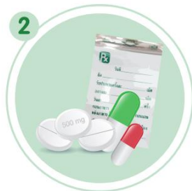
2 แจ้งการใช้ยาในปัจจุบัน