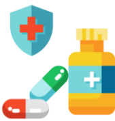
ผลิตภัณฑ์