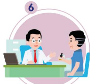
6 ประวัติด้านสุขภาพของครอบครัว