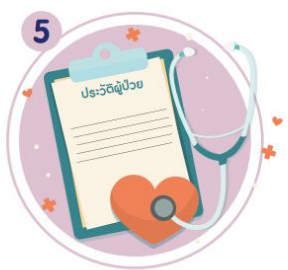
5 ประวัติการป่วยทางจิต โรคทางจิตเวช โรคจิตเภท และอาการทางจิตจากการได้รับยาต้านจิตเวช ยารักษาสมองเสื่อม