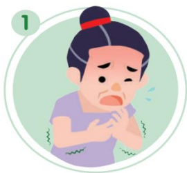
1 แจ้งอาการป่วยที่ต้องการใช้ผลิตภัณฑ์ยาแก้ยุง