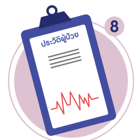
8 ประวัติแพ้สารสกัดยุง